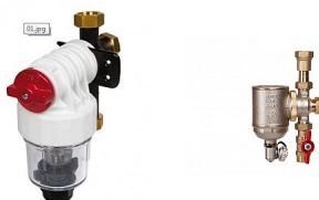
Prvky a příslušenství