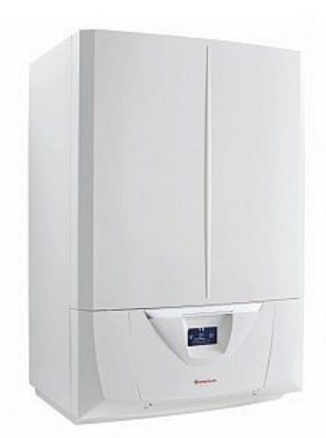
Řezemý a připojení

» Topení a ohřev vody » Kotle » Plynové kotle » Kotle se zásobníkem